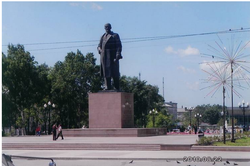
ユジノサハリンスク駅前公園にあるレーニン像 サハリン州都ユジノサハリンスク (旧豊原)