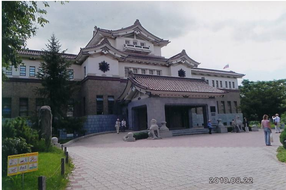
サハリン州立郷土史博物館 提供：宮内宗一会員