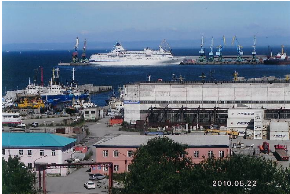
サハリンコルサコフ（旧大泊）港