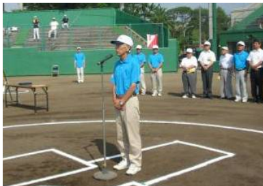
澤田体育協会会長 挨拶