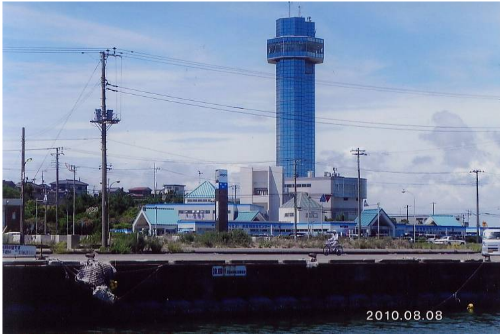
海から見た銚子ウオッセとタワー