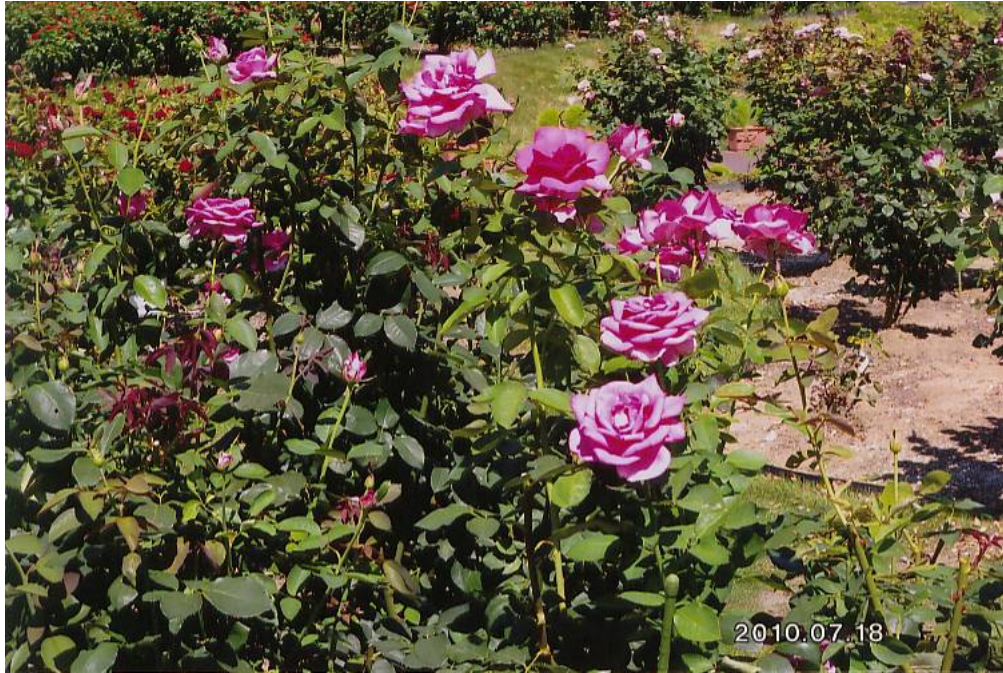
薔薇（茨城フラワーパーク：茨城県石岡市）