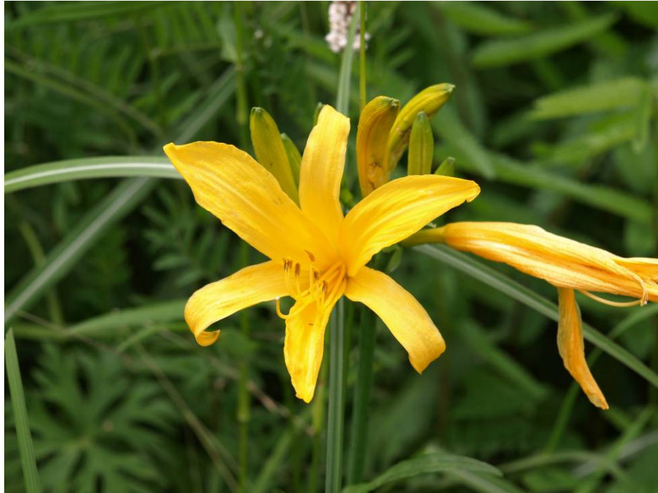
日光きすげ (箱根水生植物園)