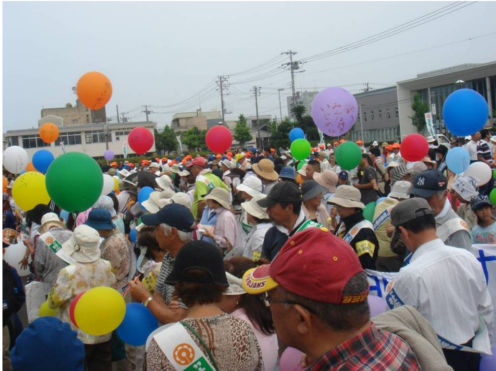
社会を明るくする運動市内パレード