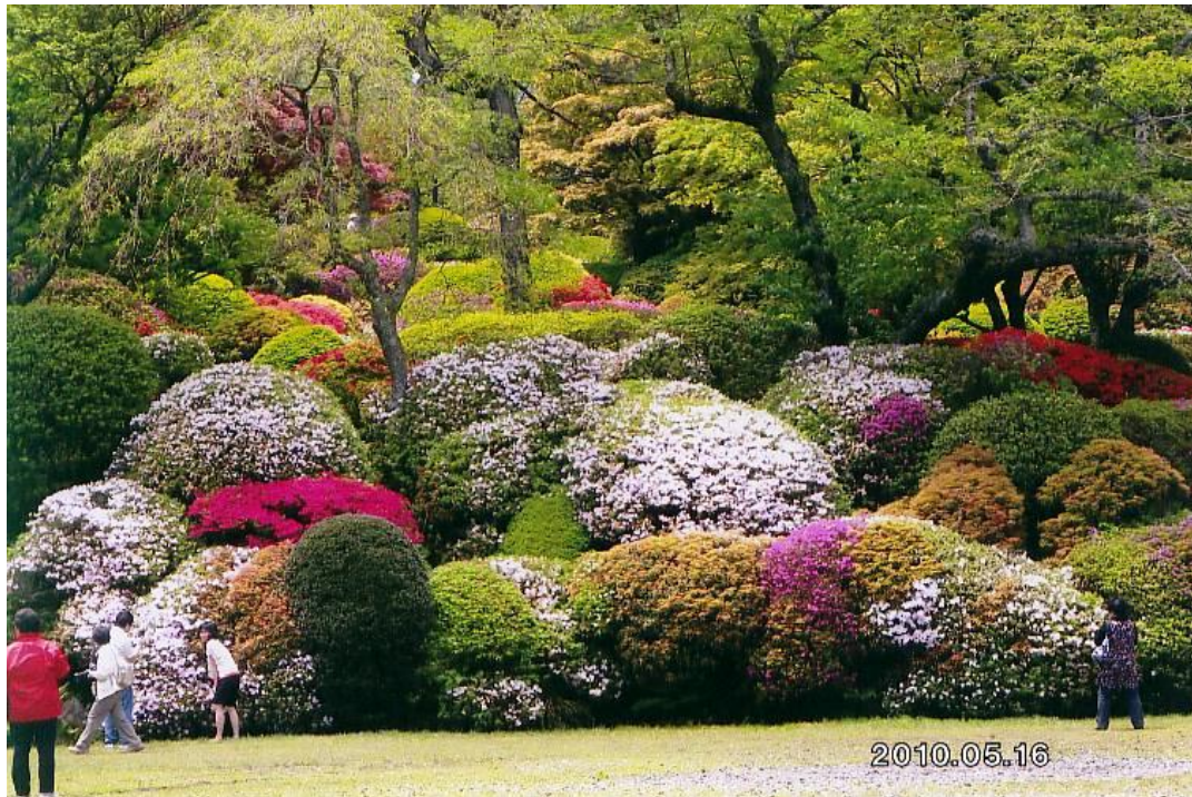
箱根蓬萊園のつつじ