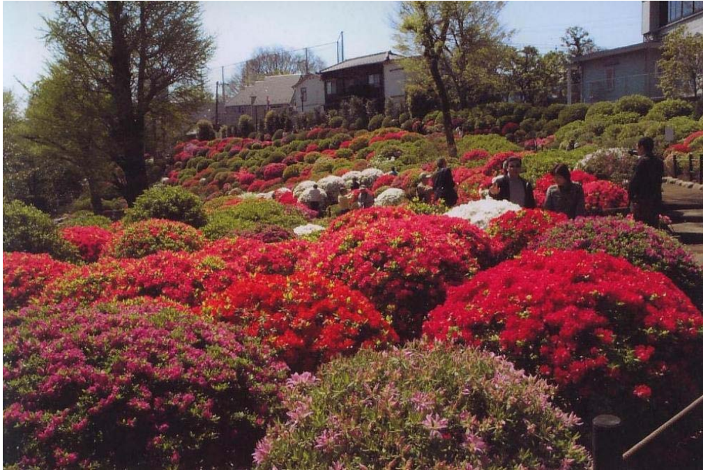
根津神社のつつじ（東京都文京区）