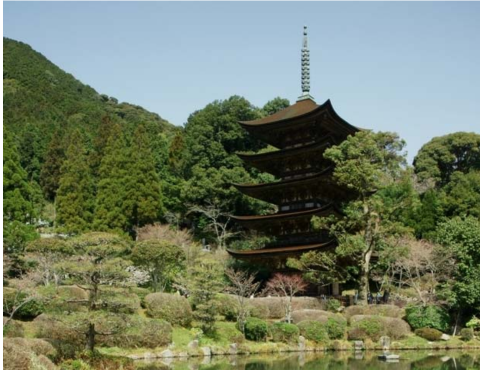
瑠璃光寺五重塔