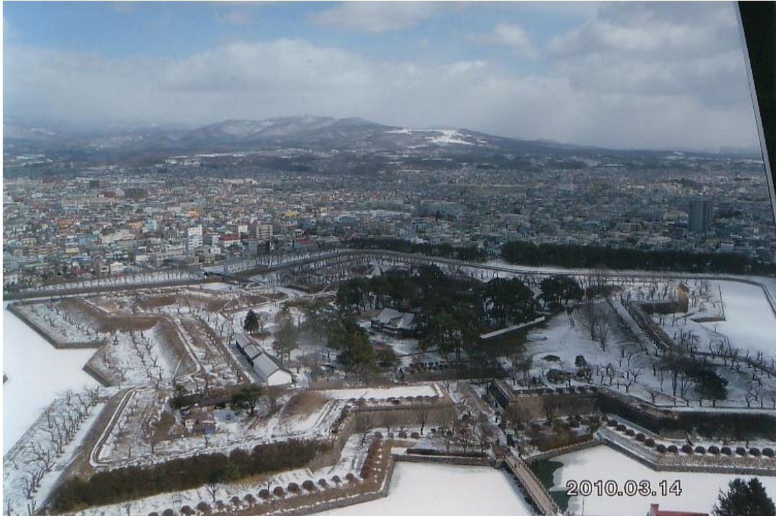
冬の五稜郭（函館市）