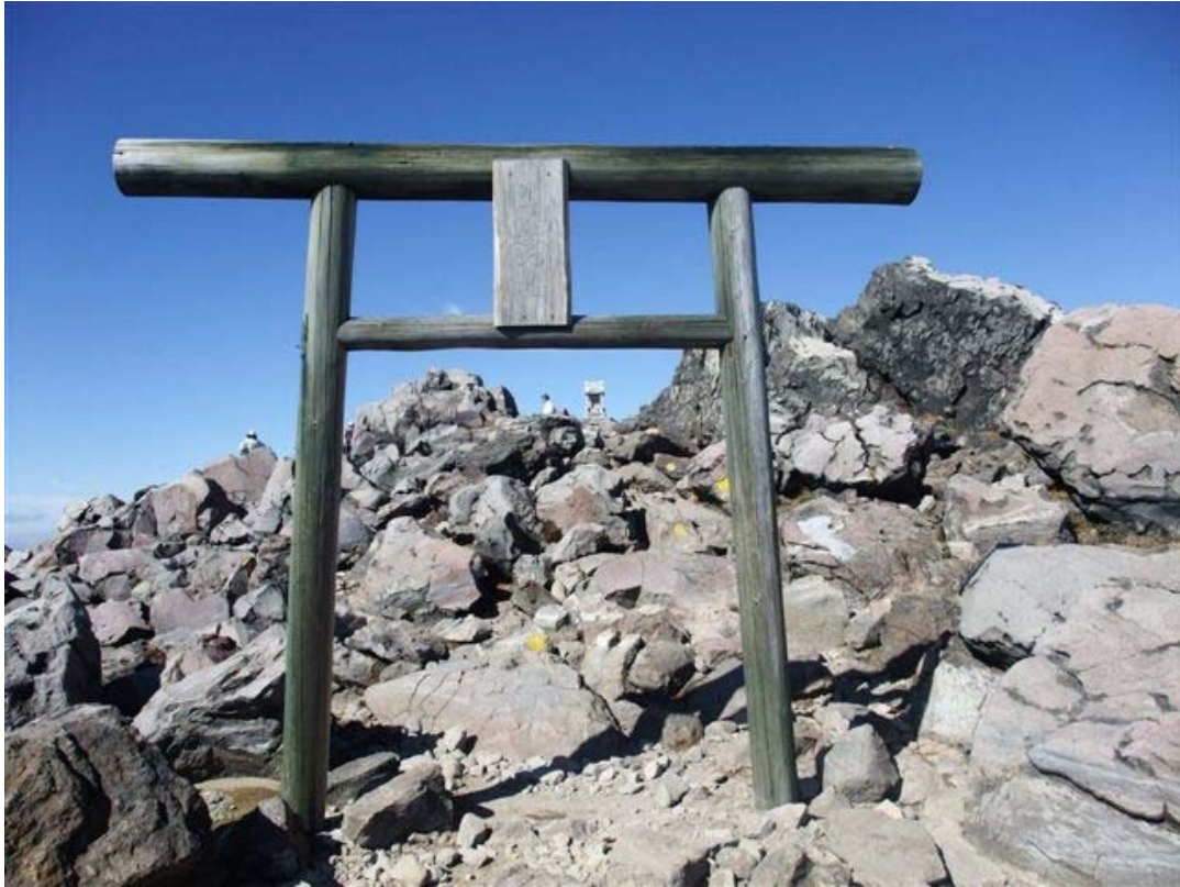
那須岳神社（茶臼岳山頂）