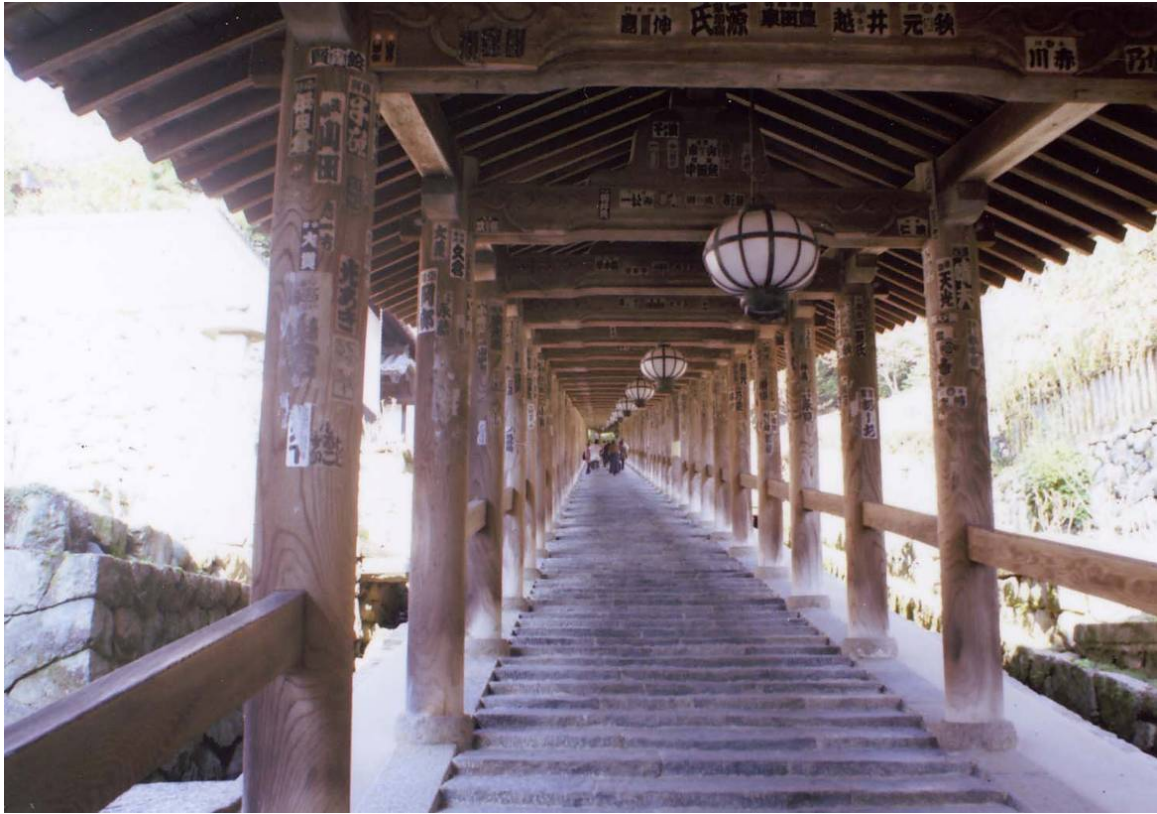
長谷寺（奈良県）登廊