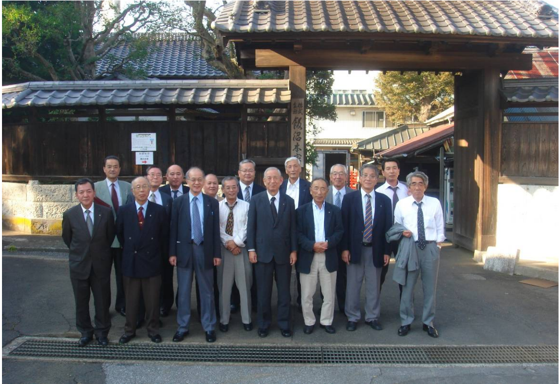
企業視察：(株)飯沼本家（酒々井）