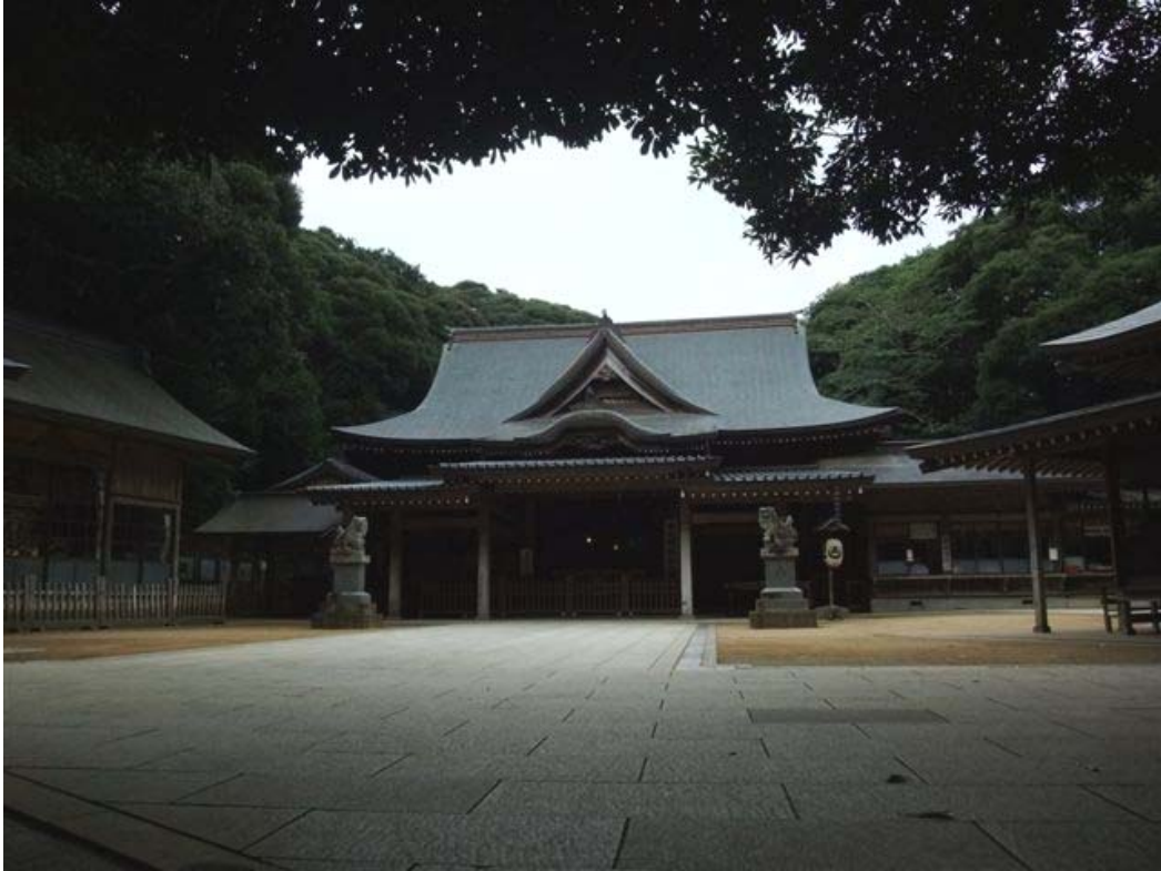
猿田神社本殿 (銚子市)