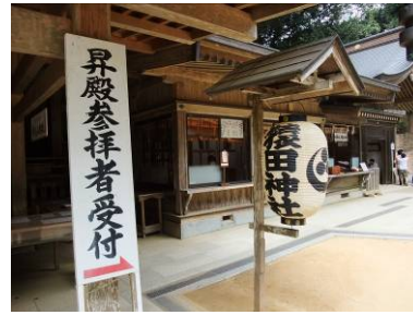
猿田神社本殿 一棟附棟札一枚