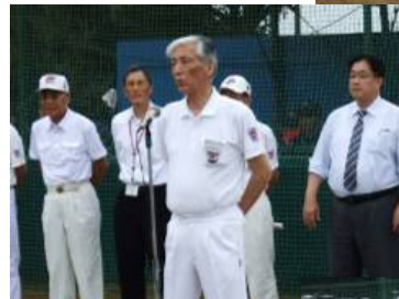
杉山銚子リトルリーグ 副会長挨拶