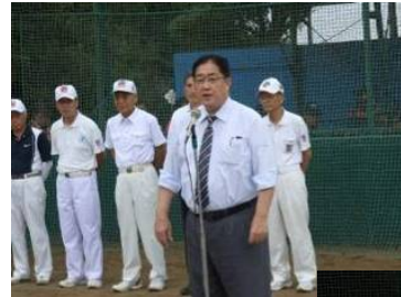
野平銚子市長挨拶