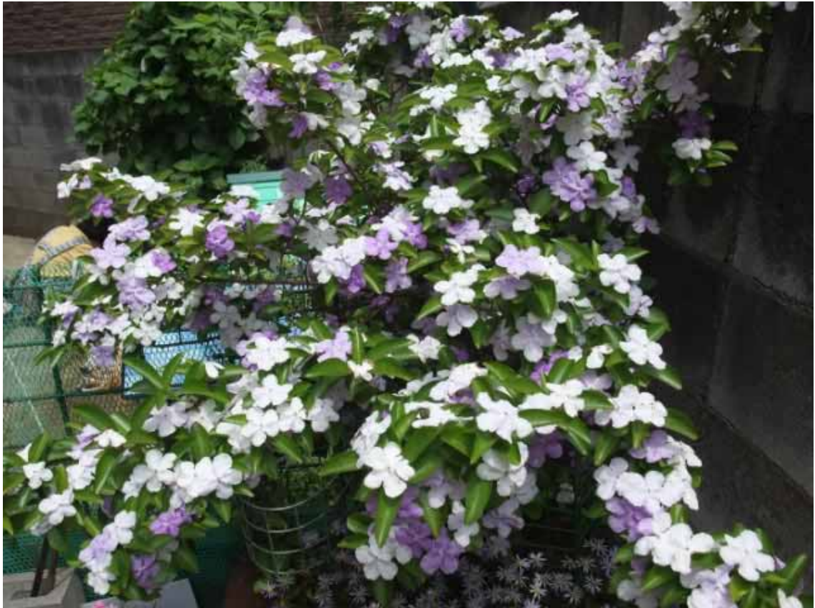
澤井家の花(においばんまつり)