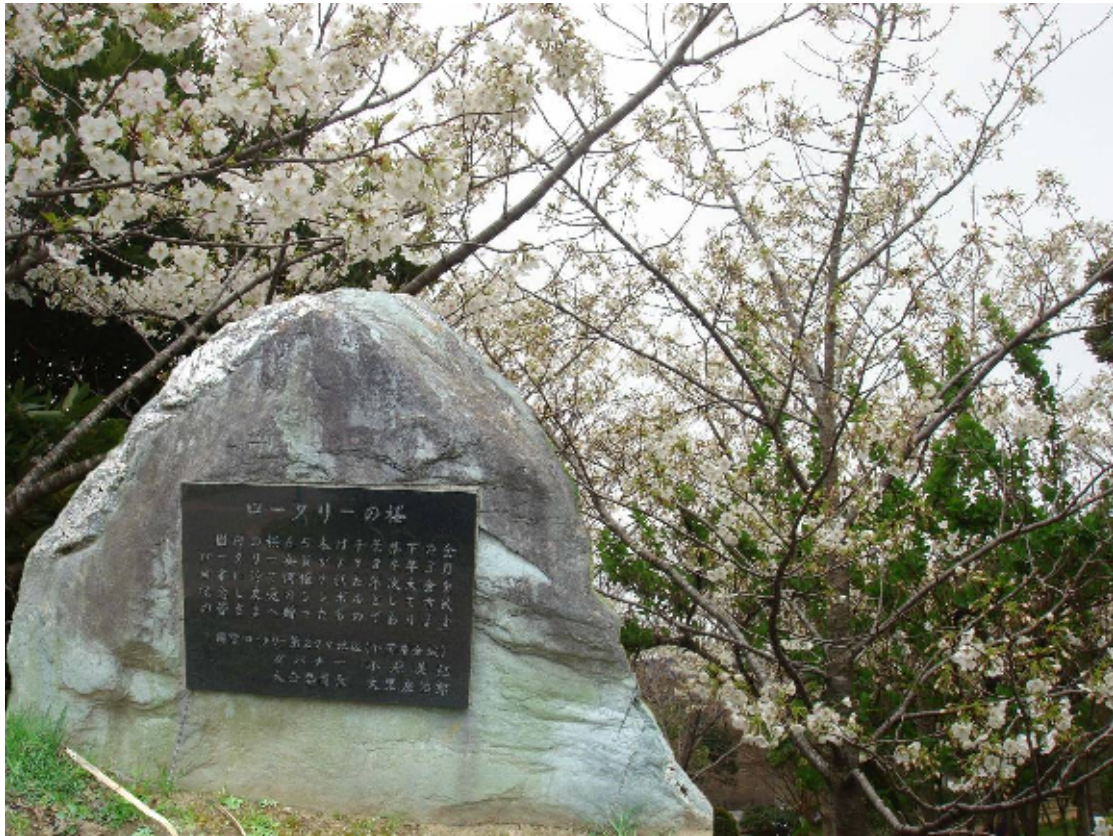
ロータリーの桜 (中央みどり公園)