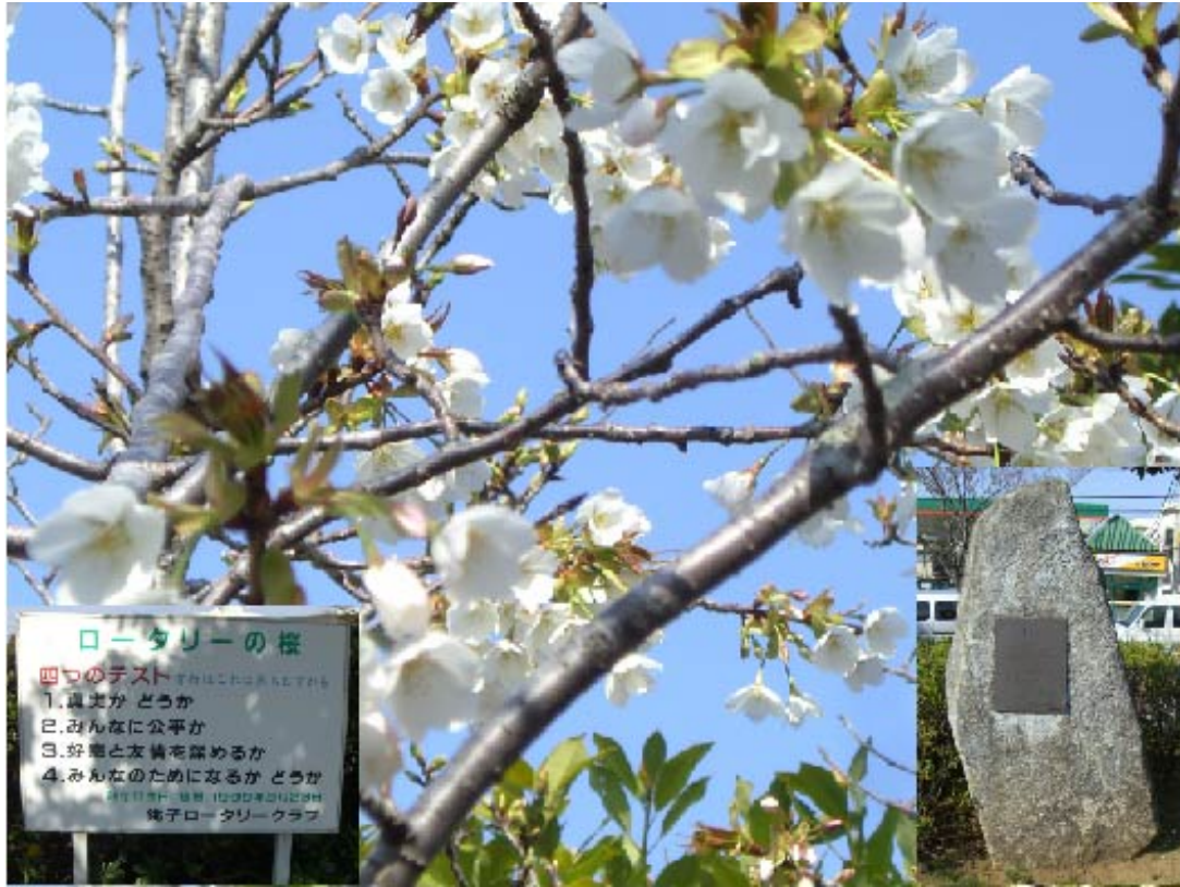
さくら・四つのテスト・石碑（中央みどり公園）