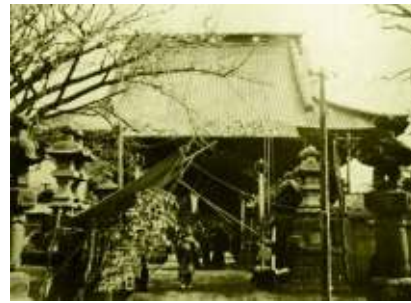
銚子飯沼観音本堂

銚子の盛り場の中心地でもあった飯沼観音も、戦災を免れる事無く昭和20年7月19日から20日未明に掛けての本市最大規模の空襲に見舞われ廃墟と化した。