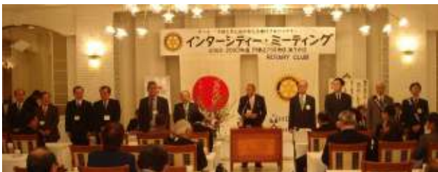
次年度G補佐・会長・幹事紹介