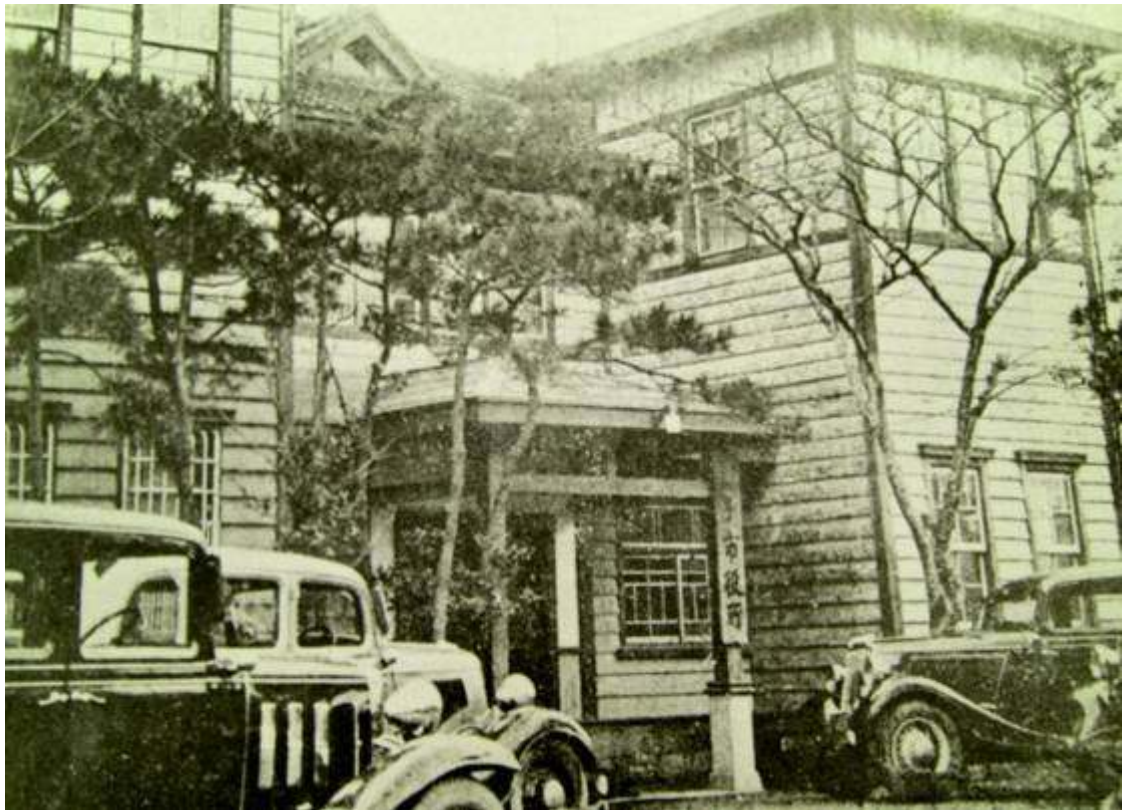
旧銚子市役所（昭和初期）