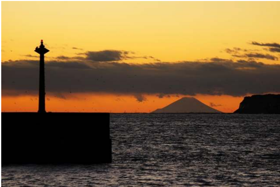
マリーナから見えた富士山