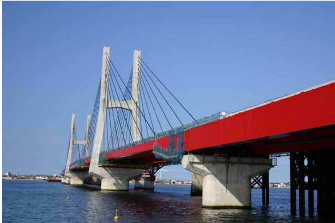
新銚子大橋