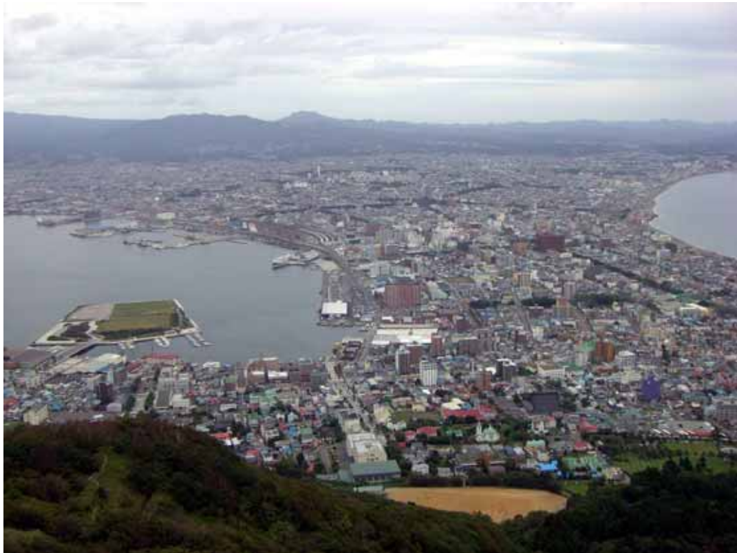
函館山から見た函館市街