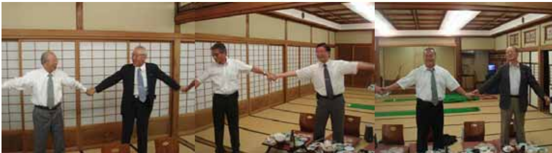
ゲーム パターゴルフ

題大新親月宴 洋上清秋名月珠 幽搖漁火有還無 皓光滿渚傾瓢爵 詩作低吟心賞俱 手感十年中秋 大新の親月の宴に赴て 岸石 菊 前 博 洋上の清秋名月珠のこし 幽かに揺る漁火還有るや無や 皓光に満ちて渚を傾け 詩作低吟して心賞を俱にせん 手感十年中秋