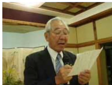
木 詩 樽 吟 定 雄 会 員

平成 20 年 9 月 16 日(火) 大新(中央町) 点 鐘 18:30 懇親会 19:00