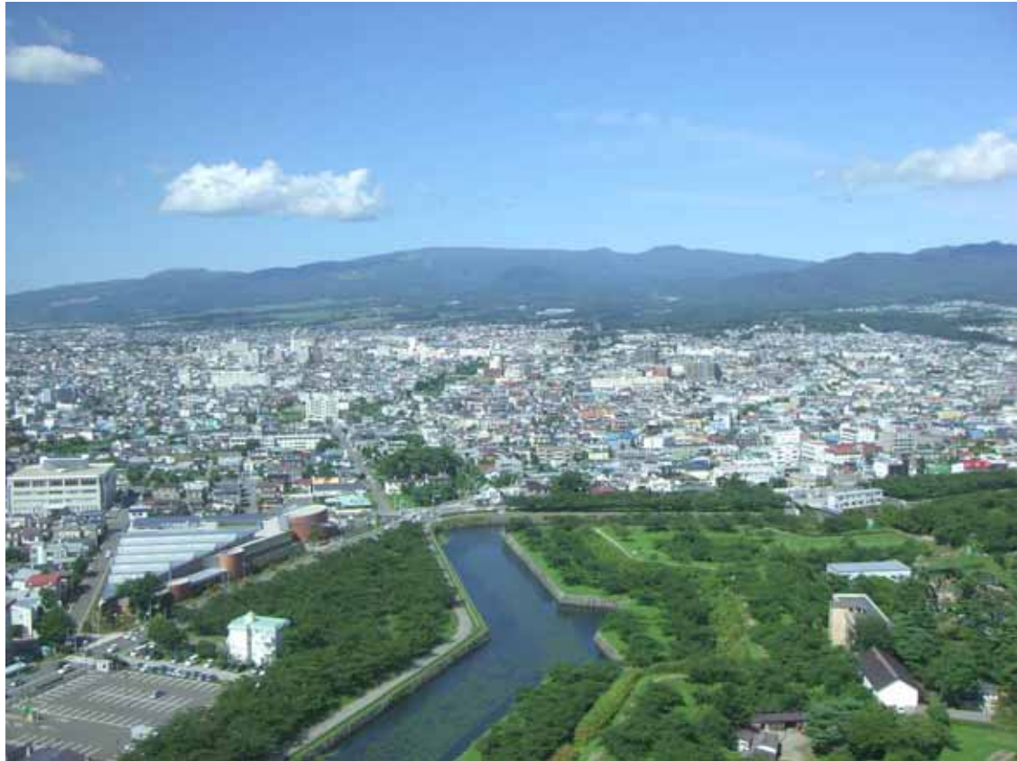
五稜郭（函館市内）から見た駒ヶ岳