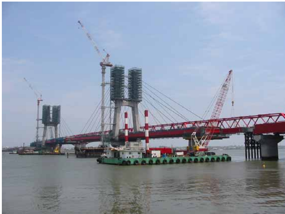
新銚子大橋桁架設中 大橋町