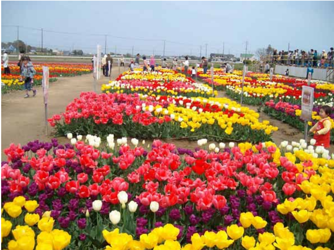
匝瑳市・野栄のチューリップ畑