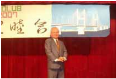
横断幕作成者 四日市 清 会員