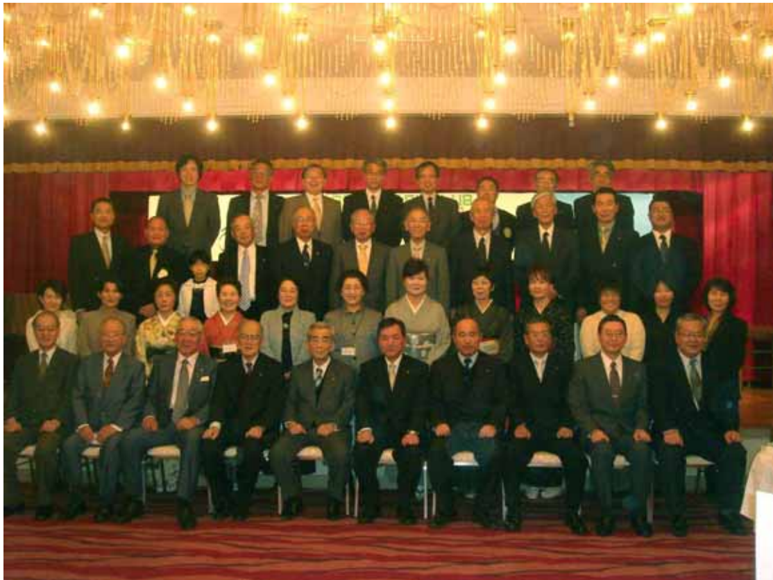
年末家族親睦会 (ニュー大新)