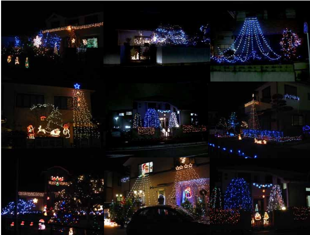
家庭のイルミネーション 銚子市内