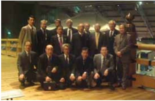
江戸東京博物館見学