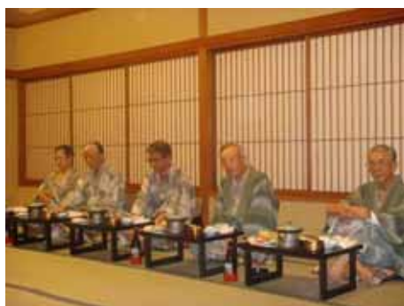
ホテルおかだ宿泊