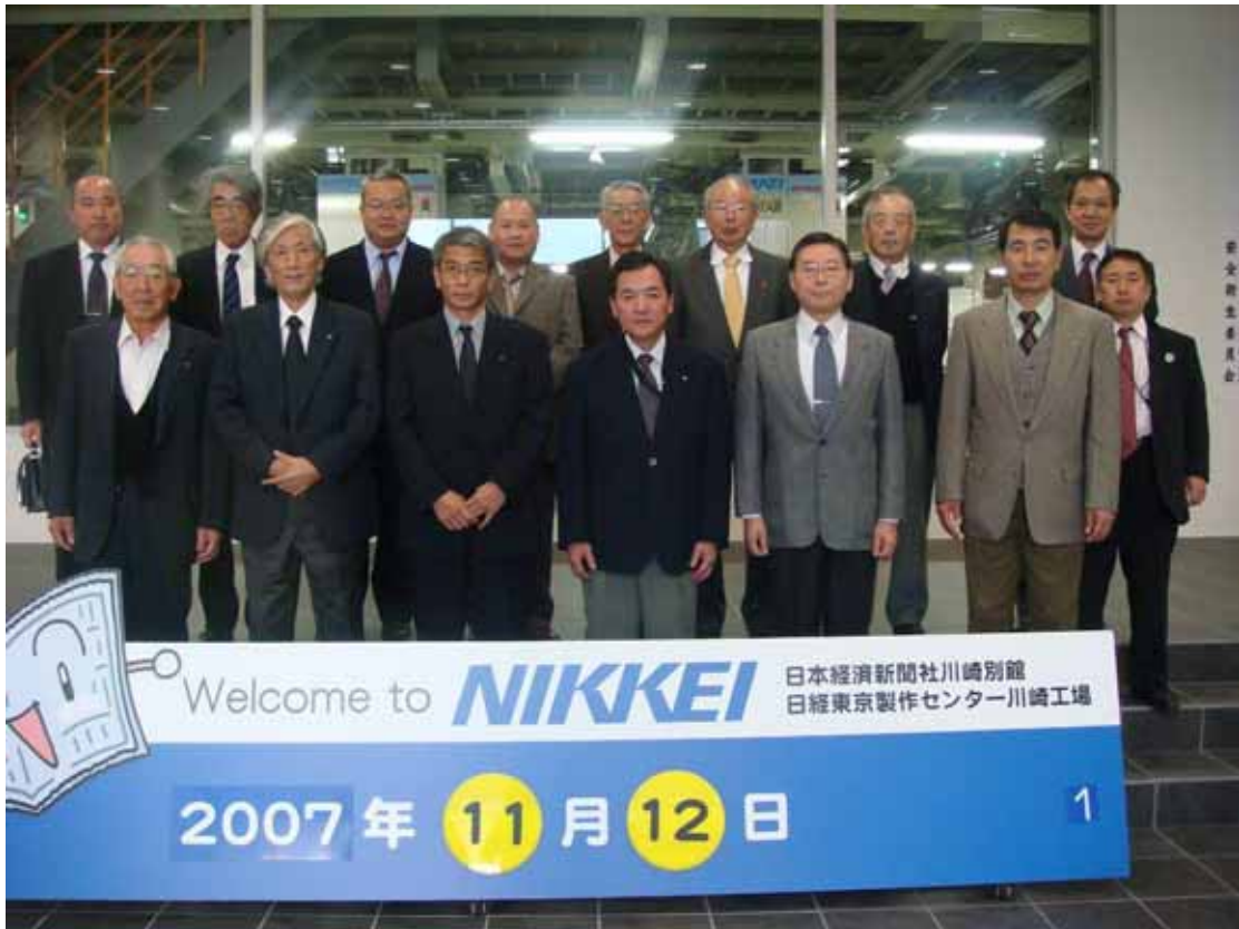
移動例会 日経新聞社川崎工場にて