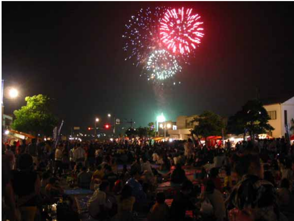
みなと祭り 花火大会