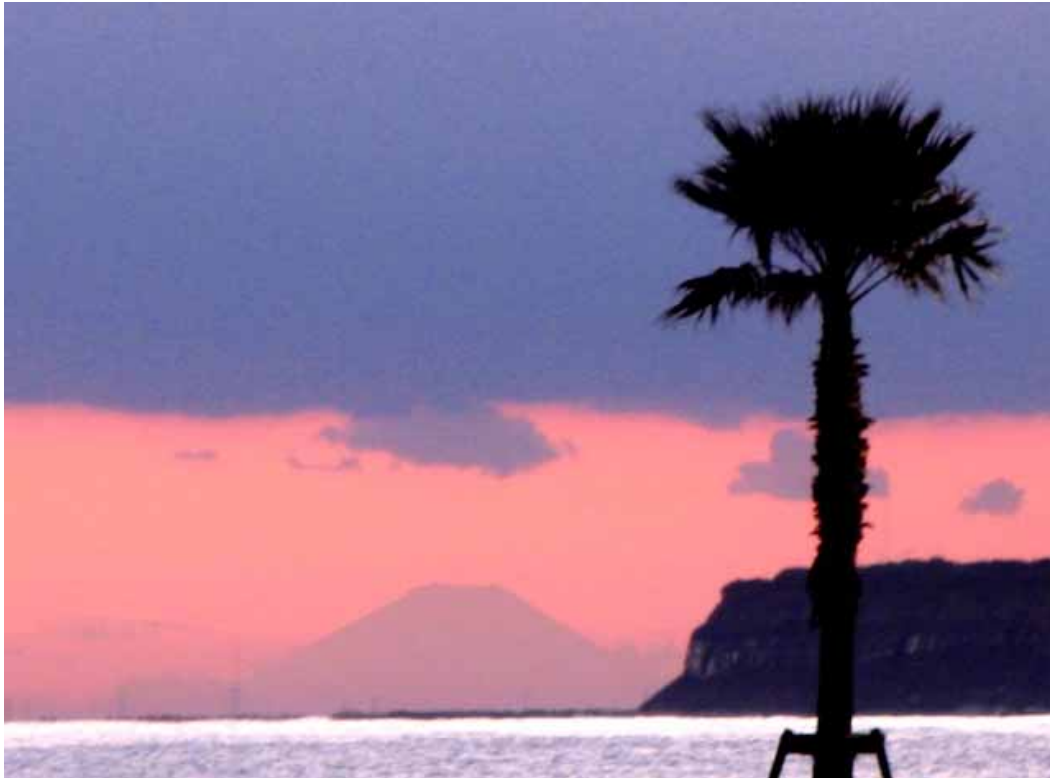
マリーナから見た富士山