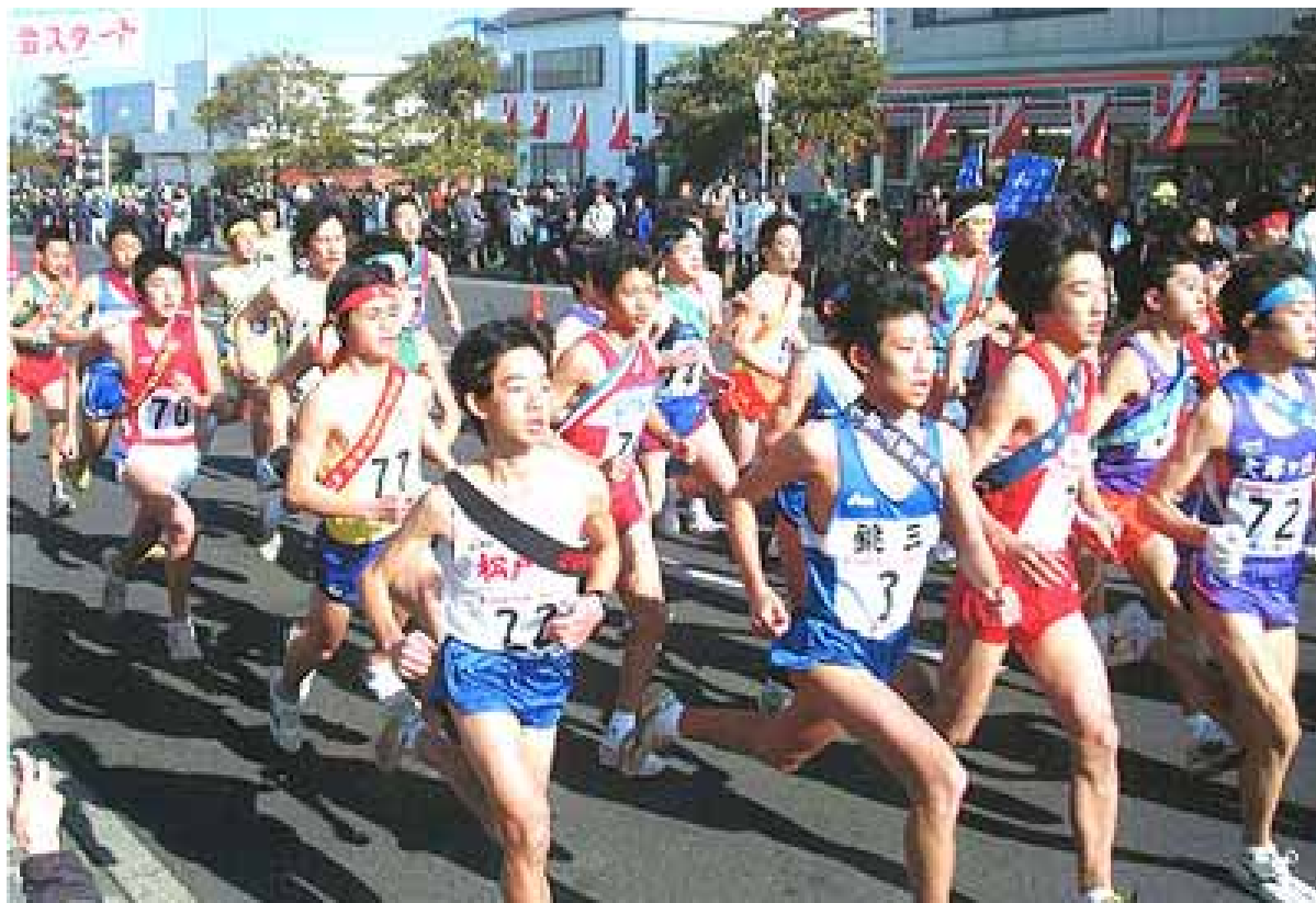
第 55 回中学校対抗銚子半島一周駅伝大会