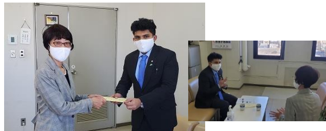
近況報告するショハーン君