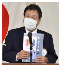
ロータリーの友7月号紹介