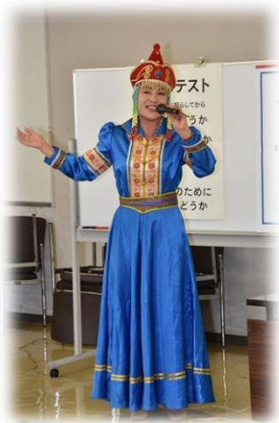
民族衣装と美しい歌声を披露してくれました。