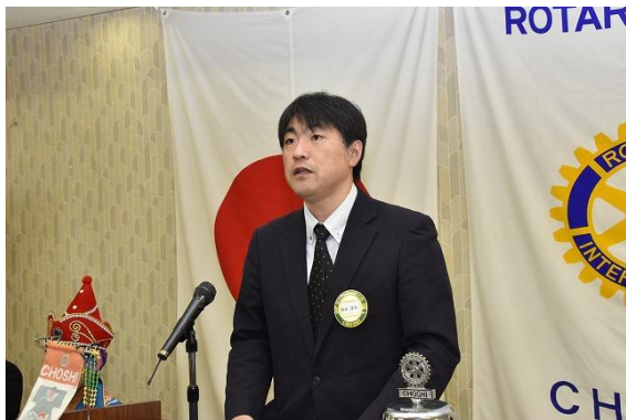
千葉科学大学ローターアクトクラブの例会報告