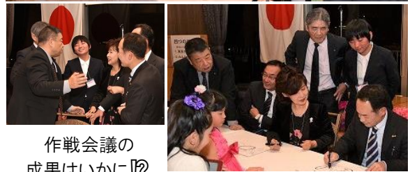
作戦会議の 成果はいかに!!