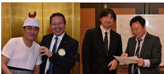
寺内親睦委員長 親睦委員の皆さん大変お疲れ様でした。