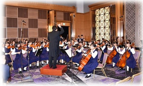
記念演奏会 千葉女子高オーケストラ部