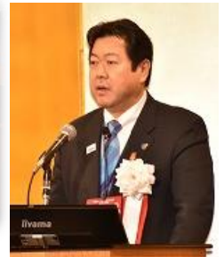
橋岡久太郎ガバナー