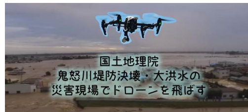
活用事例⑦防災・災害での利用