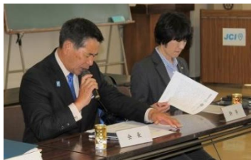
(次年度会長方針・五大奉仕委員長活動計画の発表)