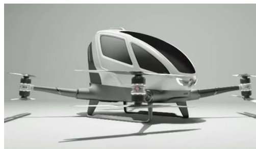
2人乗りドローン開発中国のドローンは人を乗せて空を飛ぶ。およそ1,000回テスト済み