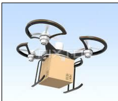
活用事例③物流での利用