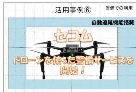
活用事例⑥警備での利用