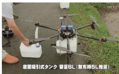
活用事例②農業での利用