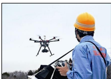
活用事例①測量での利用