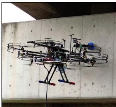
活用事例⑤点検での利用