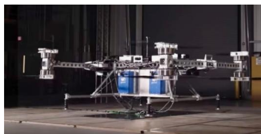
ドローンでの空輸↑ ボーイングのプロトタイプ・ドローンは227kgを空輸する半径15~30Km圏に110~220Kgを輸送する