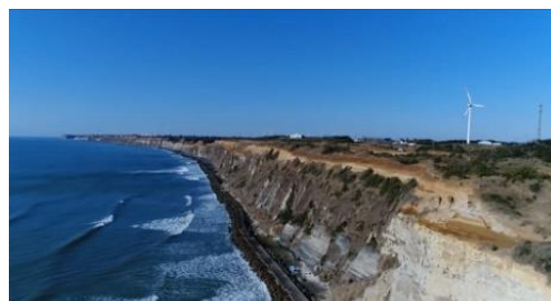
活用事例⑧空撮での利用