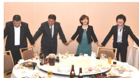
最後に 手に手つないで 唱和