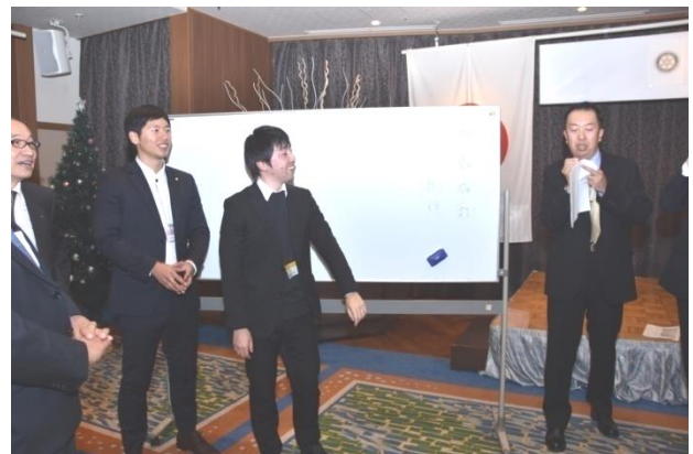
お題の(部首)漢字をいくつか書けるか