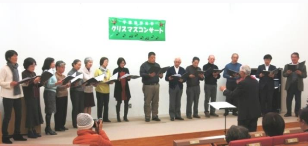
～出演～ 合唱同好会 コーロ・ハモンティアーノ