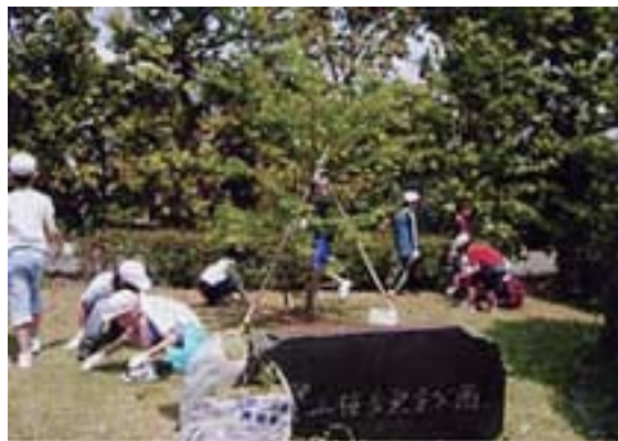
奉仕活動をする子供たち

47歳の時、事業に成功して目途がついたら後進に道を譲り、報恩社会奉仕の道をさがすべしという「新隠居論」を著した米山にとって、奉仕を理想とする人々が集うロータリークラブとの出会いは、必然であったといえるかもしれません。1905年にポール・ハリスがアメリカで創ったロータリークラブを1920年東京に設立。日本に初めてロータリークラブが誕生し、その創成期の活動の中心に立ちます。