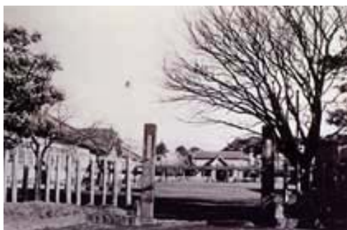
長泉小学校と米山文庫

にして神戸支店次席、同時に欧米視察の出張命令が出るなど順調なスタートをきります。その後数回に渡る海外視察を重ねて近代銀行業務の基礎を築いていきます。また日本で初めての信託会社となる三井信託株式会社を創立して、初代社長に就任します。