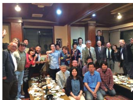
千葉科学大学RAC新入会員歓迎会 5月10日(土) 18:00 又兵衛