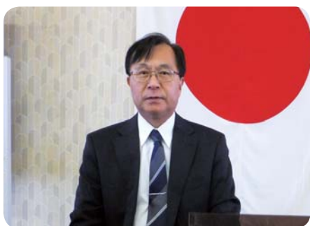
銚子市教育長 石川善昭様