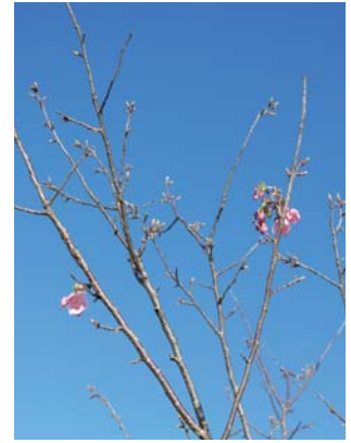
宮内清次 会員 撮影日 3月31日