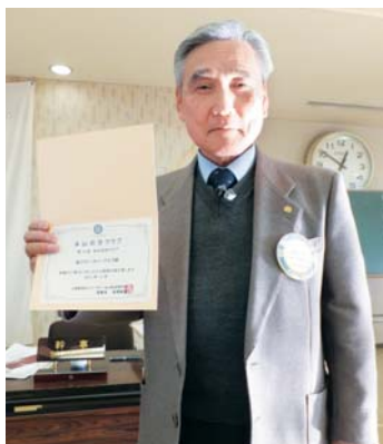
第19回 米山功労クラブ感謝状