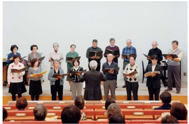
第8回 千葉科学大学 クリスマスコンサート 合唱(コーロ・ハモンティアーノ)

(なお、患者数の経緯などの詳細は配布資料を参考にしていただけましたらと思います)