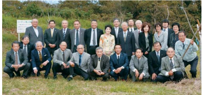
10月23日例会終了後、ロータリー憩いの森サクラ植樹記念撮影会を行いました。