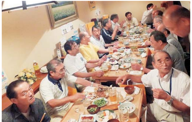
なごやかな親睦会