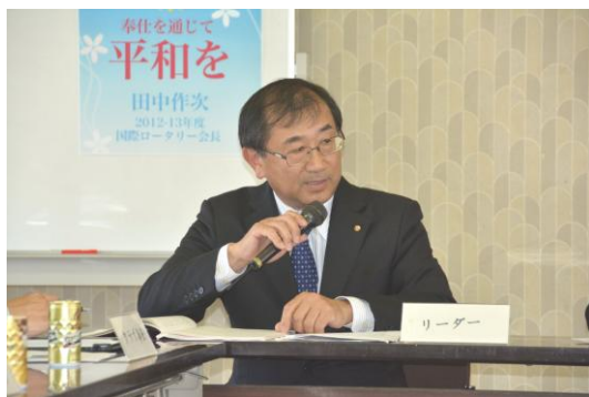
リーダーは青野会員